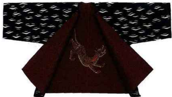
« Tiger Coat : Ganzl », tapisserie contemporaine de Jon Eric Riis. Galerie Chevalier, 17, quai Voltaire.

Carré Rive Gauche. Du 27 au 29 mai. Vernissage le 26 mai de 17 h à 23 h. Les 27 et 28 de 11 h à 20 h ; le 29 de 11 h à 18 h.